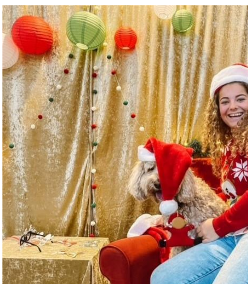
Woensdag 13 december: Foute kerstdingendag