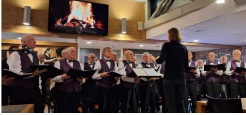
Donderdag 14 december Het Alphens Mannenkoor