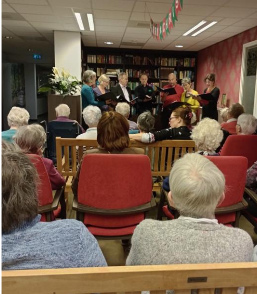
Woensdag 13 december Koor Het Zingend Hart