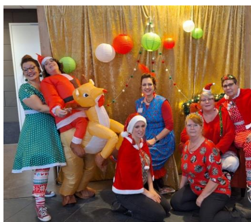
Woensdag 13 december: Foute Kerstdingendag