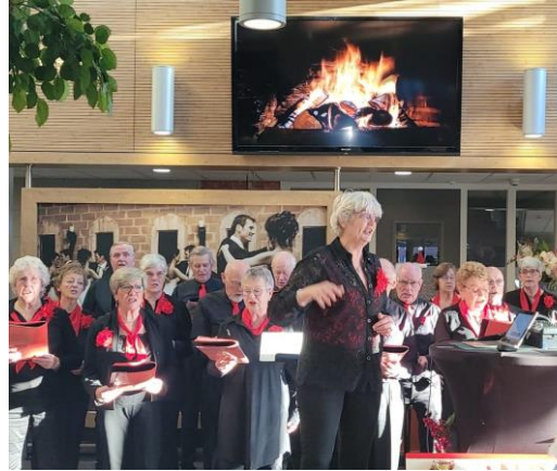
Zondag 17 december Meezingkoor Eigenwijs