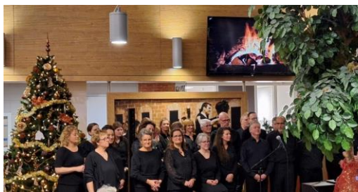
Vrijdag 8 december: Koor de Promissing Voices