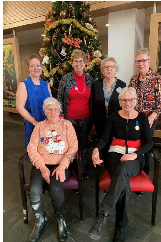
Donderdag 21 december ons "eigen" Oudshoornkoor, wat niet zonder de vrijwilligers en dirigent kan!