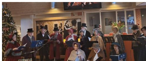
Zondag 10 december: Dickenskoor