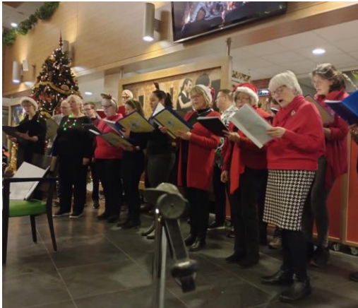
Dinsdag 19 december Vocaal ensemble Ridderspoor