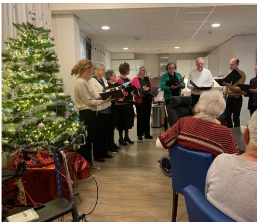
Woensdag 13 december Koor Het Zingend hart

Via een facebook oproep kregen we allemaal huisjes waarvoor hartelijk dank! En in een van de huisjes zat i.p.v. een wit waxinelichtje een gouden waxinelichtje: Korenveld 11 vond hem en won een Kerstbrood!